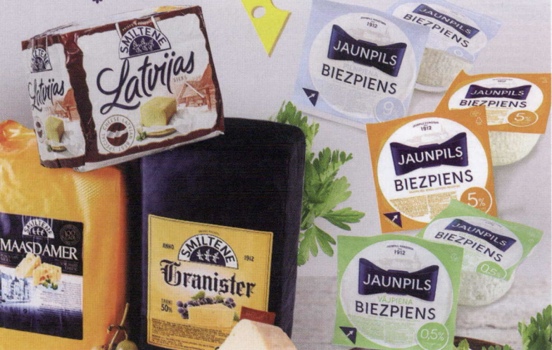
AS Smiltene piens un AS Jaunpils pienotava sortiments.

izskaidrojams ar faktu, ka Eiropas valstīs, tāpat kā pie mums, nestrādā sabiedriskās ēdināšanas iestādes.